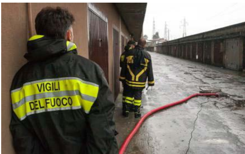
I vigili del fuoco impegnati in uno degli interventi al Cambonino